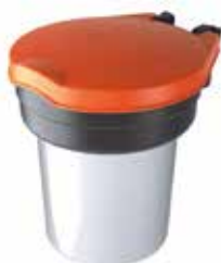
Pojemnik z pokrywą