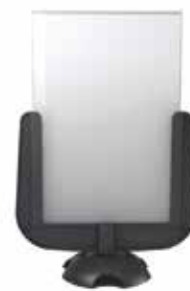
Uchwyt do znaku A4