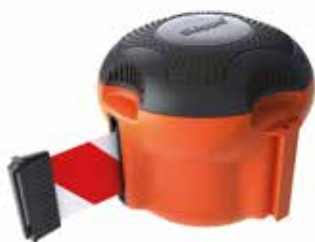
Kaseta Skipper XS z taśmą