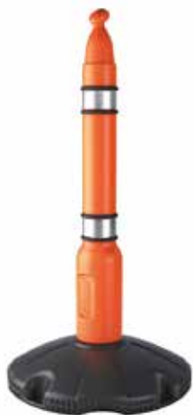
Słupek z podstawą

KOD PRODUKTU: POST01 (SŁUPEK) POST02 (PODSTAWKA)