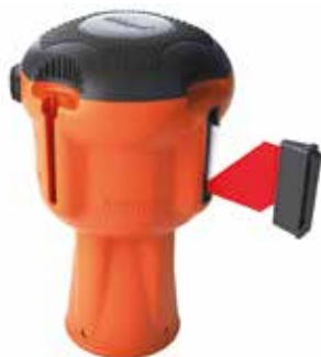
Kaseta Skipper z taśmą