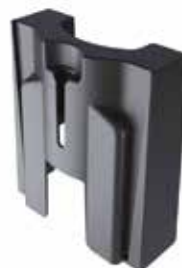
Dystans do zaczepek przyssawkowego