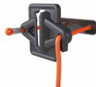
Zaczepek linkowy magnetyczny