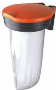
Uchwyt na worek z pokrywą